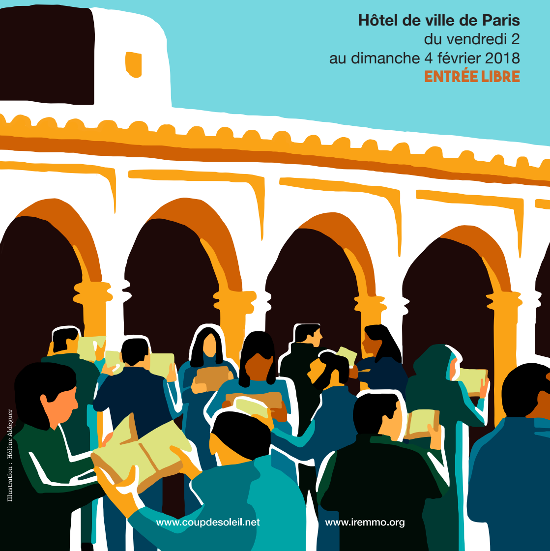
Illustration : Héléne Adégner

Hôtel de ville de Paris du vendredi 2 au dimanche 4 février 2018 ENTRÉE LIBRE