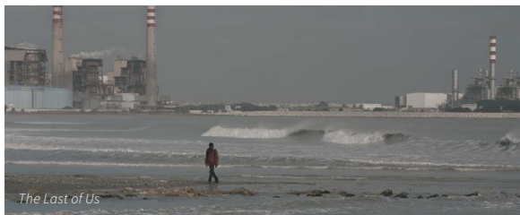
The Last of Us