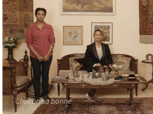
Chacun sa bonne