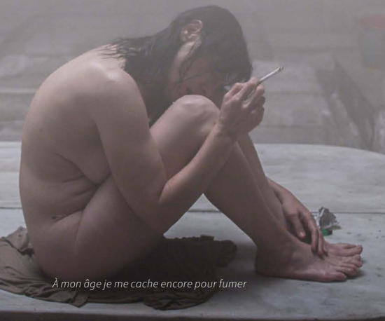
À mon âge je me cache encore pour fumer

Prix du public au Festival de Thessalonique 2016.