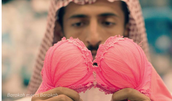
Barakah meets Barakah