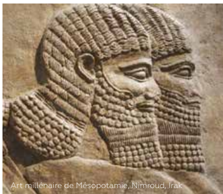
Art millénaire de Mésopotamie, Nimroud, Irak