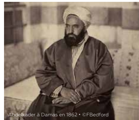
Abdelkader à Damas en 1862 •