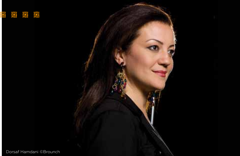
Dorsaf Hamdani