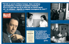
Visuel de l'exposition "Génération : un siècle d'histoire culturelle des Maghrébins en France".

http://www.generiques.org/images/ZIP/C4-H-1250mm-800mm-04-06.pdf.zip