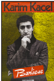
Banlieue. Karim Kacel. 1984. Affiche. EMI Music France

http://www.generiques.org/images/ZIP/I_05_054_5Q_03.jpg.zip