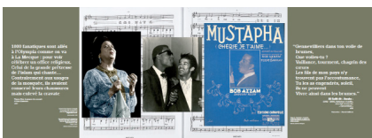
Visuel de l'exposition "Génération : un siècle d'histoire culturelle des Maghrébins en France".

http://www.generiques.org/images/ZIP/C4-A-B-2144mm-800mm-04-06.pdf.zip