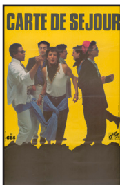
Carte de séjour. 1984. Affiche. Collection Association Génériques

http://www.generiques.org/images/ZIP/I_05_054_5Q_03.jpg.zip