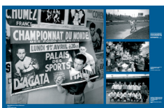
Visuel de l'exposition "Génération : un siècle d'histoire culturelle des Maghrébins en France".

http://www.generiques.org/images/ZIP/C4-K-1250mm-800mm-04-06b-bd.pdf.zip