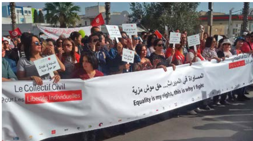
Marche pour l'égalité dans l'héritage, Tunis, 10 mars 2018.

Militantes, entrepreneures, artistes, blogueuses, chercheuses... :