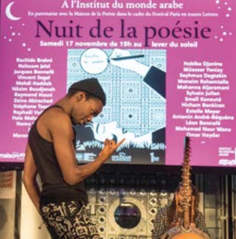
Small Kanouté

de mon aïeul. Presque, car c'est un quart de queue, alors que l'original était un piano droit.