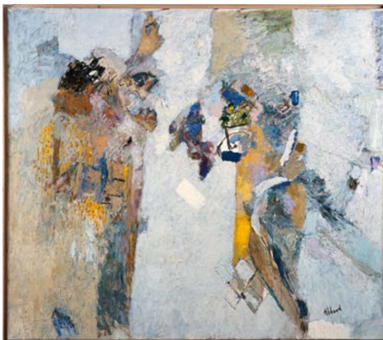
Shafic Abboud, L'Aube, 2003. Huile sur toile, 105 x 120 cm