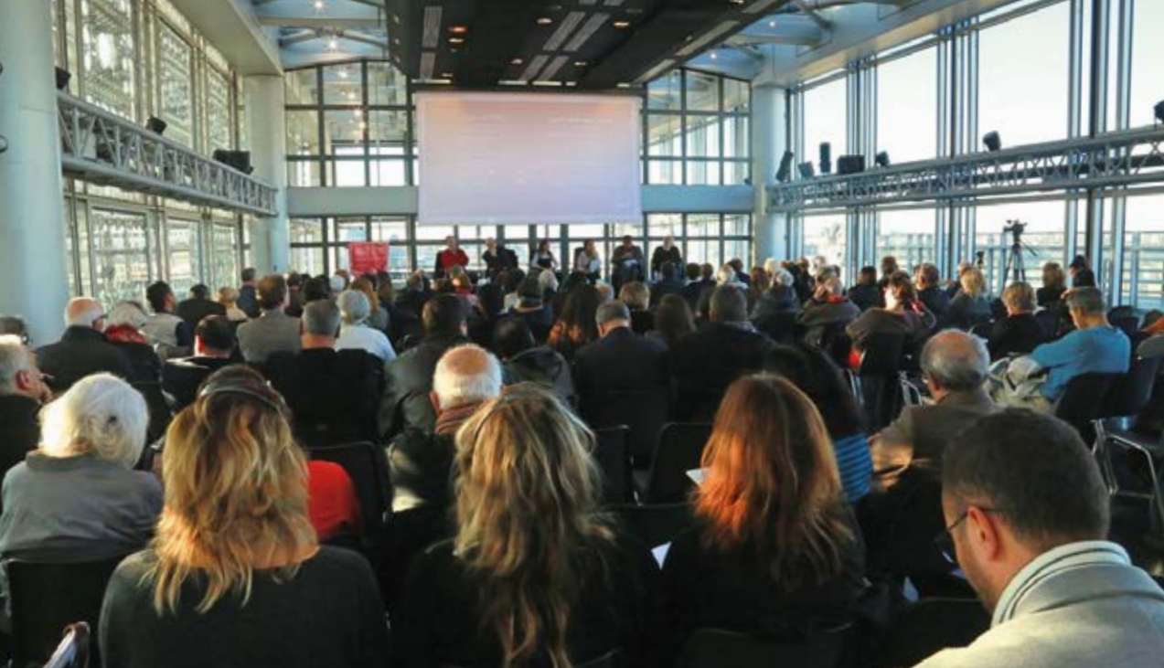
Une des rencontres de la Chaire de l'IMA, salle du Haut-Conseil.