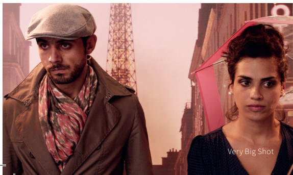
Very Big Shot