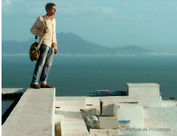
Parfum de Printemps

Aziz, surnommé «Zizou», jeune diplômé au chômage, quitte son bled pour monter à la Capitale, Tunis. En quête d'un métier, il devient installateur de paraboles sur les toits. Il circule dans tous les milieux, des plus aisés aux plus démunis. Il tombe fou amoureux d'une jeune fille de Sidi Bou Saïd qui n'a pas le droit de sortir de chez elle, quand éclatent les prémices de la Révolution de 2011... Grand retour de Férid Boughedir, réalisateur en 1990 de Halfaouine, l'enfant des terrasses, le film tunisien le plus connu dans le monde.