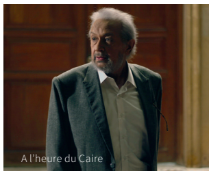
A l'heure du Caire