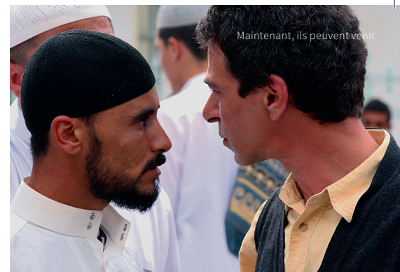
Maintenant, ils peuvent venir