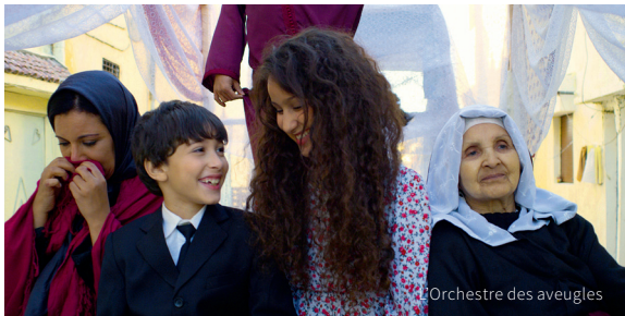
L'Orchestre des aveugles