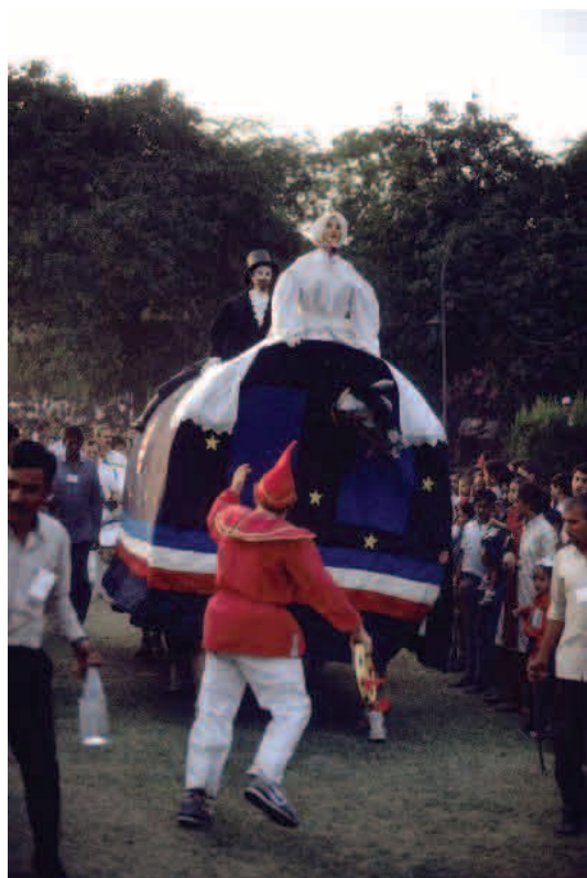
Poulain de Pézenas

Personnages gigantesques et animaux processionnels