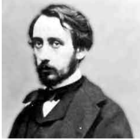
الفنّان الفرنسي إِدْجَار دوجا