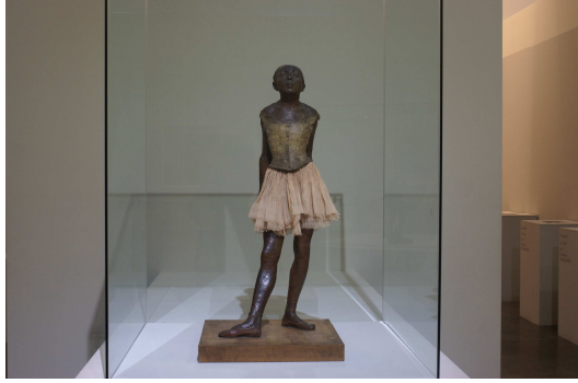
تمثال "الراقصة الصغيرة" لإدجار دوقا